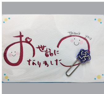
輪島診療所職員からのお礼

先日、映画「あの花が咲く丘で、君とまた出会えたら」を観に行きました。第二次大戦末期の昭和20年6月にタイムスリップした現代の女子高生が、知覧特攻基地と富谷食堂を思わせる場を舞台に、特攻隊員の青年との時空を超えた切ない恋の物語です。特攻隊員たちは戦争や特攻隊に疑問を抱きながらも、愛する人を守るためと言い聞かせて理不尽な死を受け入れて出撃していきました。原作者は、高校教員時代に今の高校生が戦争や特攻のことをあまり知らない現実を直面し、自分より若い世代の人たちに継承しなければとの想いで執筆したとのこと。SNSを中心に話題になったことで、家族連れや若者など多くの方が観に来て、自分たちの身に寄せて「戦争は悪」を考える機会となり成功だと思っています。今も、世界では指導者の都合でロシアのウクライナ侵襲やイスラエルのガザ地区侵襲などの戦争が起こり、そこで暮らす人々の日常が一瞬にして奪われ、子どもを含む多くの人が無差別に大量虐殺されています。これに日本も間接的に加担しており、戦争は更に長期化し、広がりそうです。私達も「平和とよりよい生活のために」の活動を若い世代の人たちへと広げ、声を挙げて、私たちの手で平和をつくっていきたくて思っていました。(K・J)