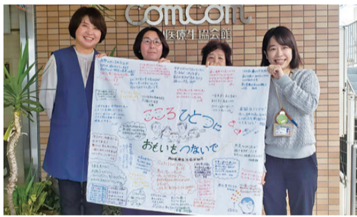
組合員・職員からのメッセージを石川県民医連へ