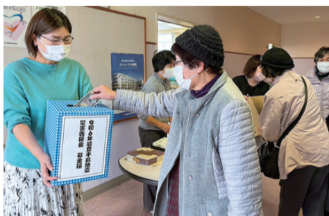
地域活動の中での募金呼びかけ