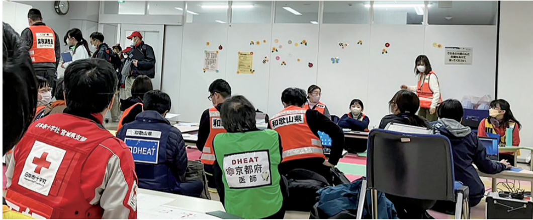
各地から集まった支援チーム

いま、岡山医療生協は ●組合員数 61,637人 ●出資金 19億3,402万円 ●1人平均出資金 31,377円 (2024年2月20日現在)