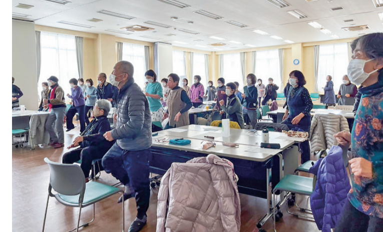
体操でリラックス