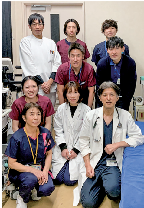
心臓リハビリテーションチーム

心不全は「心臓の機能が低下して息切れやむくみが生じる」病気で、慢性化すると徐々に進行していきます。再発・悪化を繰り返すたびに体力も低下し、特に高齢の心不全では心臓だけでなく様々な病気を合併し、フレイル、認知症、社会的孤立など複合的